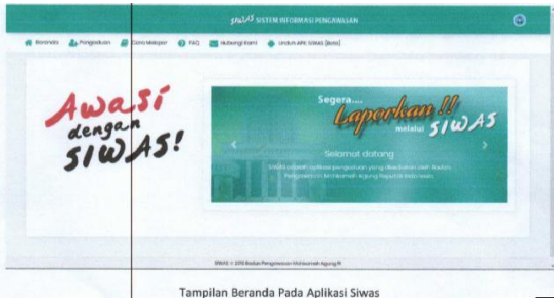
Tampilan Beranda Pada Aplikasi Siwas